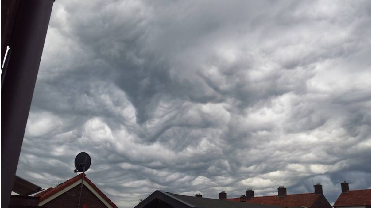
H.a.a.r.p.-bewolking boven Nederland, zomer 2015. Dit is dus géén nieuwe wolkensoort, zoals ons voorgelogen wordt.