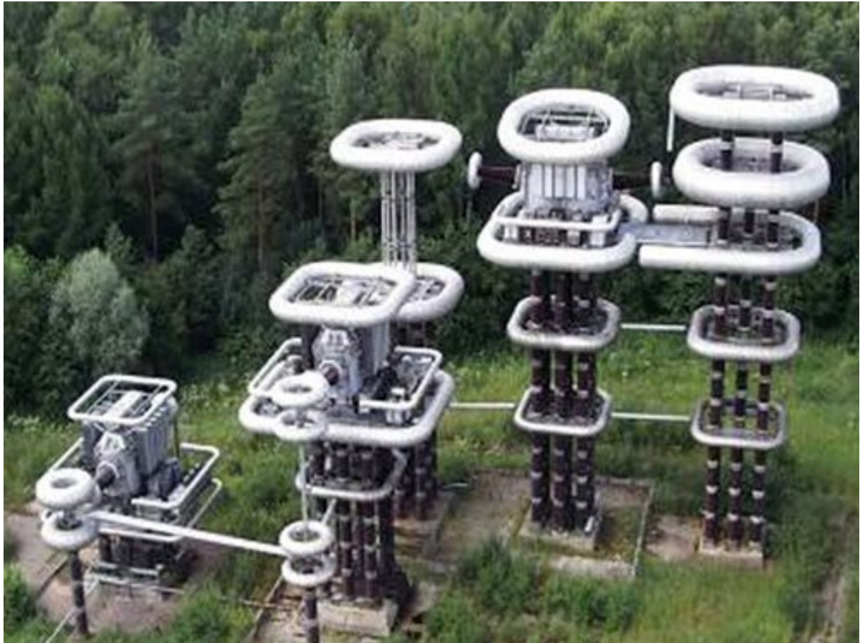
h.a.a.r.p.-installatie Alaska en Rusland