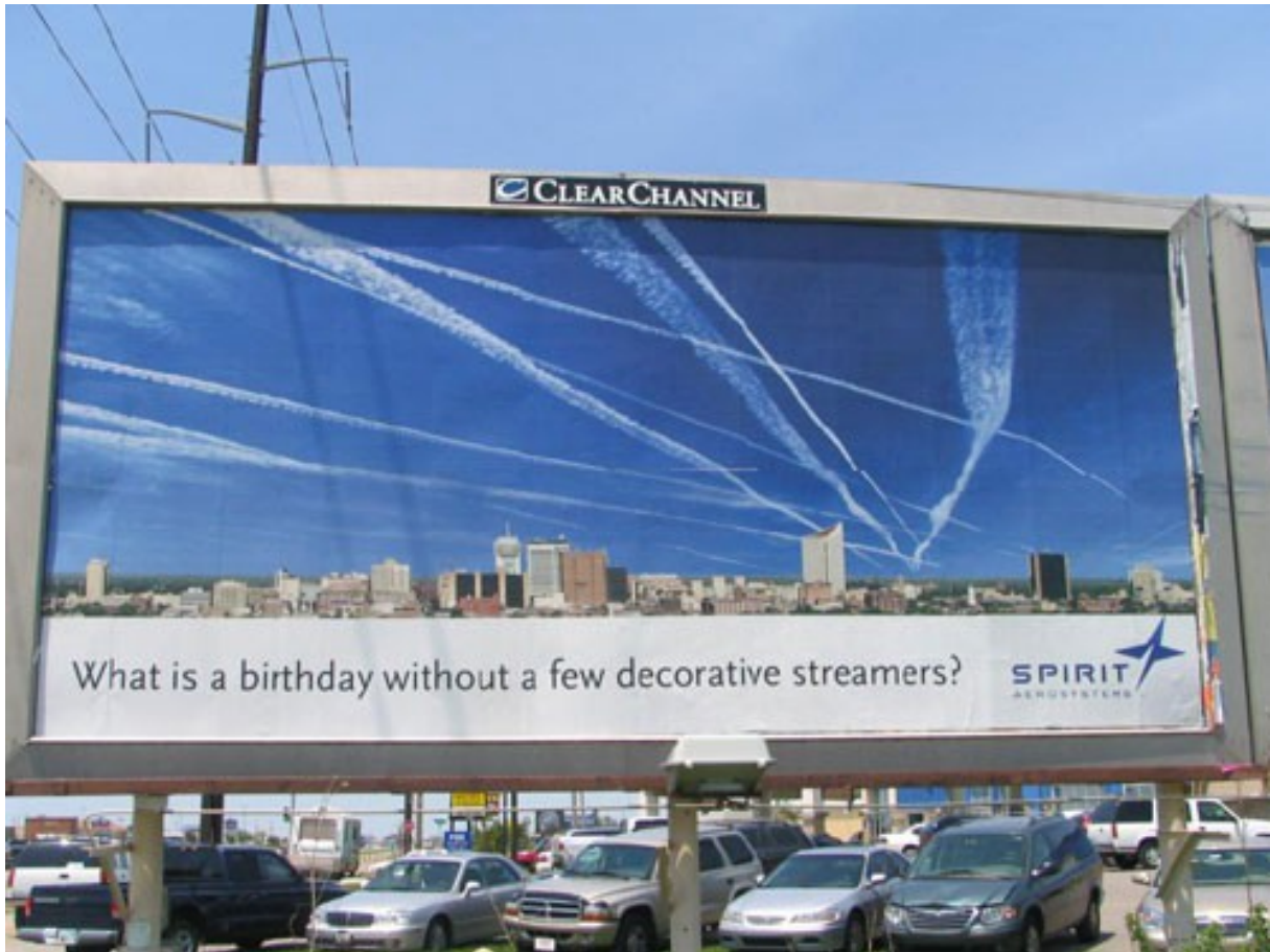
Billboards langs de weg in de V.S.