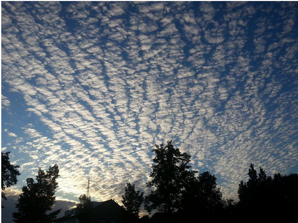
H.a.a.r.p.-bewolking boven Nederland, zomer 2015

Is dit toeval of is het ook juist de bedoeling van de Amerikaanse overheid dat Europa en andere landen noodgedwongen moeten stoppen met biologische landbouw en over moeten stappen op aluminium -en droogtebestendige Monsantozaad?