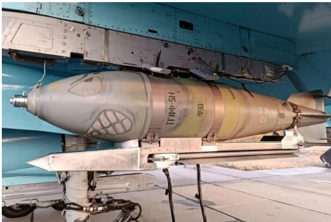
Afbeelding ter illustratie - geen Kinzhal

R usland heeft zojuist bewezen dat zijn hypersonische raketten de verdediging van de NAVO met gemak kunnen doorboren, wat een militaire game-changer betekent en mogelijk binnenkort ook een diplomatieke als het Westen beseft dat het beter is in te stemmen met een staakt-het-vuren na afloop van het komende tegenoffensief van Kiev dan hun NAVO-proxy-oorlog tegen Rusland te laten escaleren tot een conventionele oorlog in een streven naar “Balkanisering” van die aangevallen grootmacht, schrijft Andrew Korybko .