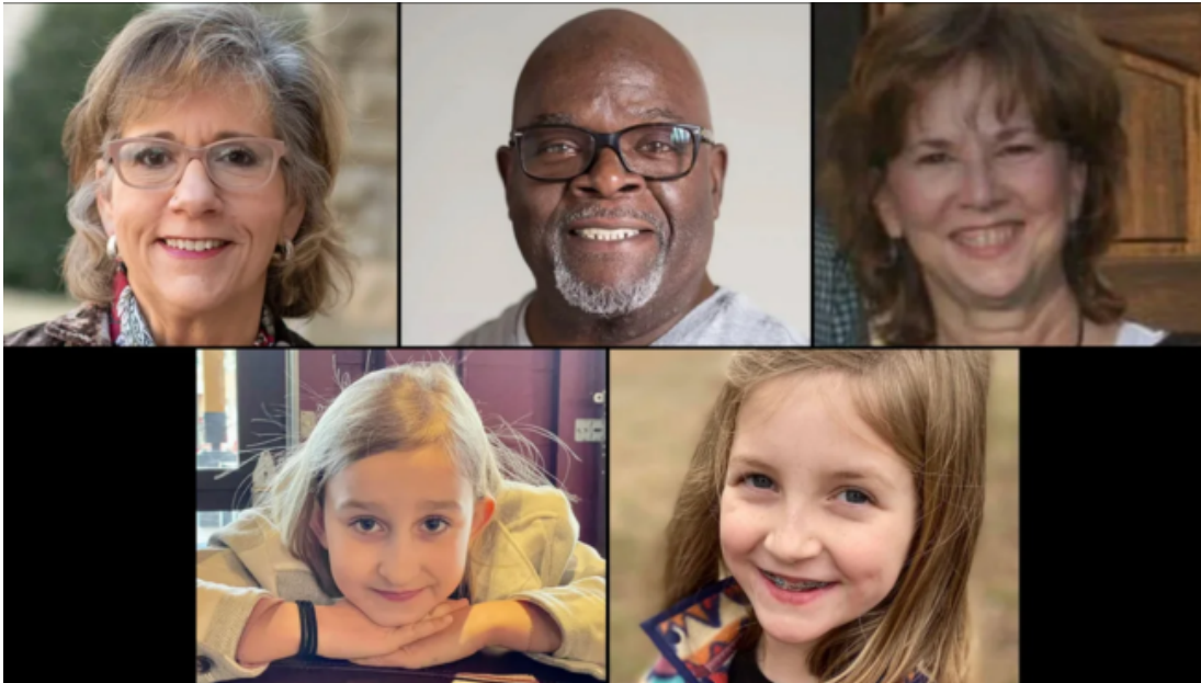
Zes onschuldige levens werden genomen omdat ze toevallig naar een christelijke school gingen.

Terwijl de massamedia wanhopig proberen het verhaal te veranderen, maken LGBTQ-groepen overuren om ervoor te zorgen dat het door de moordenaar geschreven manifest voor altijd verborgen blijft. De reden: de wereld zou de gewelddadige en radicale onderstroom begrijpen die deze beweging in haar greep houdt. Ook zou de moord kunnen worden aangemerkt als een antichristelijke haatmisdrijf en/of een daad van transterrorisme. Dit druist allemaal in tegen de verhalen die door de elite worden gepusht.