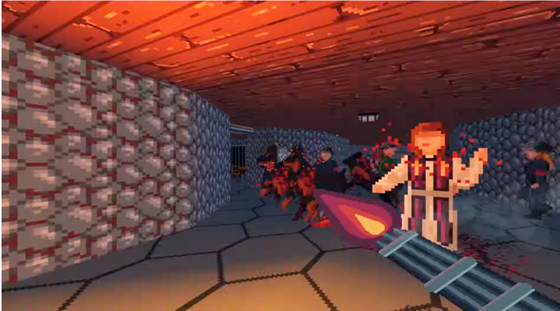
Met het spel kunnen spelers priesters op verschillende gewelddadige manieren doden.

Laat je opgekropte woede los op de genderkritische tirannen met een arsenaal aan dodelijke wapens en tactieken in louterende gelukzaligheid.