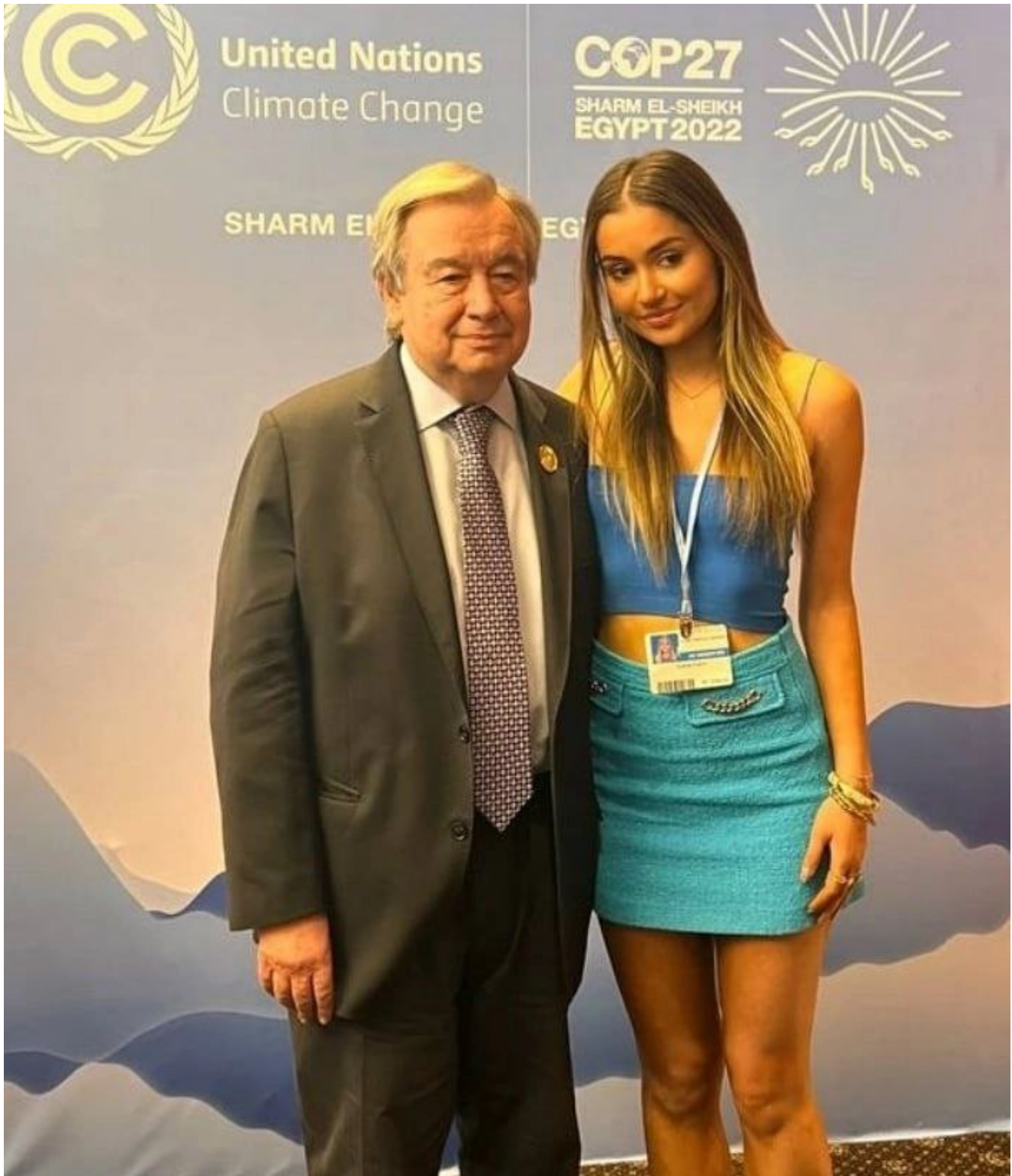
Guterres met zijn ' assistente' tijdens de klimaatconferentie in Egypte

Guterres 'kookt' zelf af en toe, en dat is omdat de oude viezerik zich omringt met veel te jonge meisjes op zijn dure feestjes.