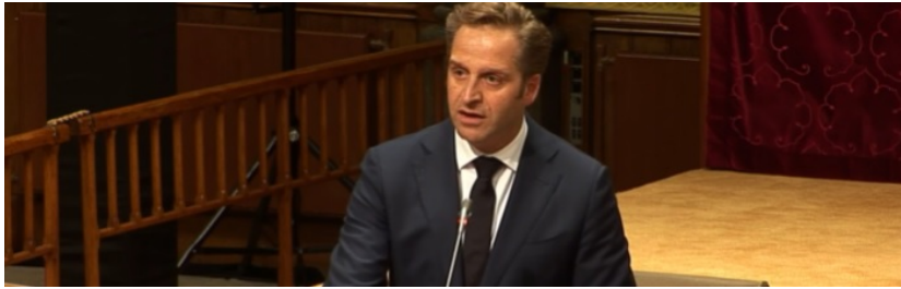
Foto: Hugo de Jonge (T weede Kamer der Staten- Generaal CC BY-NC-ND 2.0)

Homepagina » Mens en Dier » De Jonge: coronavaccin is 'gave uit Gods hand', luister niet naar 'wazige antivaxverhalen'