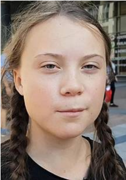
Gretha Thunberg

Ook het NOS-Jeugdjournaal doet volop mee aan het indoctrineren van de kindergeest hoe de mensheid schuldig is aan de opwarming van de aarde. Wat de kinderen te horen krijgen is niets anders dan misselijkmakende eenzijdige propaganda. Greta Thunberg wordt met haar klimaathysterie als een held aan de jeugd gepresenteerd. Zij komt over als iemand die de weg volledig kwijt is. Ze noemt zichzelf een klimaatactivist met Asperger . Klimaat extremisten gebruiken haar voor hun politieke doeleinden om hun klimaatgekte aan de man te brengen.