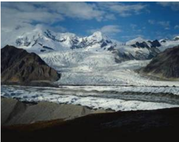
Gletsjer in de Himalaya

Volgens het IPCC zullen in het jaar 2035 alle gletsjers in de Himalaya verdwenen zijn . Wetenschappelijk onderzoek zou ondubbelzinnig aantonen dat de gletsjers van dit gebergte in een moordend tempo aan het smelten zijn. Maar ook hier zit het VN-Klimaatpanel er volkomen naast want de in werkelijkheid krimpen deze ijsmassa's namelijk helemaal niet meer. De klimaatwetenschappers van dit panel beroepen zich op een verkeerd persbericht van het Wereld natuur Fonds overgenomen van een Russische studie. Een glacioloog ontdekte dat de voorspelling het jaar 2350 betrof. Iemand verwisselde bij het typen de 0 de 3 en de 5. Op dit niveau werken sommige klimaatalarmisten. De ene na de andere mythe wordt ontmaskerd. De Indiase geoloog en glacioloog Kumar Raina stelde begin 2009 dat de informatie van het IPCC over het smelten van de gletsjers niet klopte, maar kreeg ogenblikkelijk een felle aanval van IPCC-topman Rajendra Pachauri te verduren. Raina deed een diepgaande studie naar de ontwikkeling van gletsjers in het Himalaya gebergte en ontdekte dat de afkalving reeds in 2007 tot stilstand is gekomen.