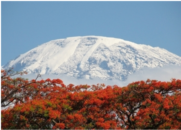
Sneeuw op de Kilimanjaro (2018)

Zo gebruikt hij de filmbeelden van de orkaan Katrina en suggereert dat deze een gevolg is van de opwarming. Gore verspelde ook dat de sneeuw op de Kilimanjaro (de hoogste berg van Afrika) “binnen een decennium” zou smelten. Maar heden ten dage ligt er meer sneeuw op de Kilimanjaro dan ooit tevoren. De grootste sneeuwval is gemeten in 2018.