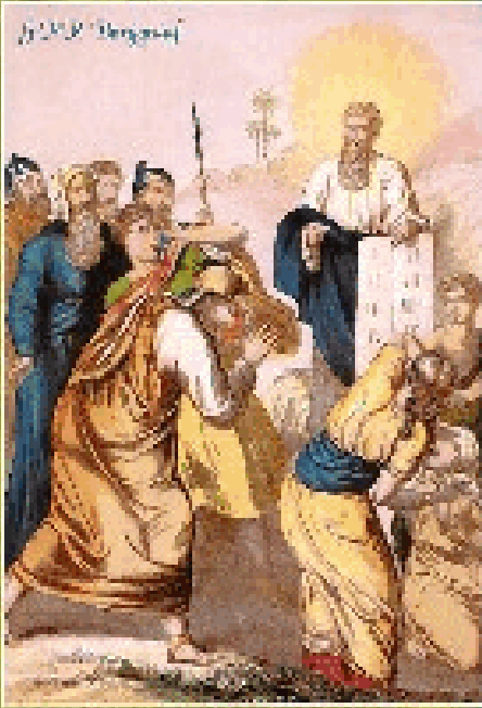
Op de afbeelding in de tekst staat de tekst: 'Opdat ik gode leven zou' (Johannes 2:17)