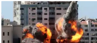
'Zee van lijken' in Israël, vele doden in Gaza als schokaanval Hamas oorlog ontketent