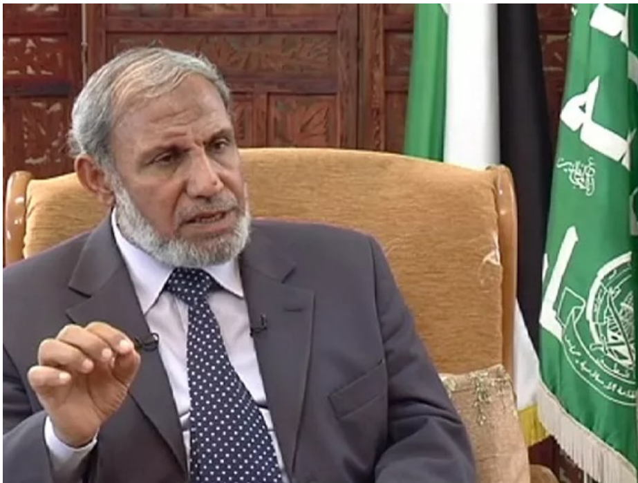
Mahmoud Al-Zahar, leider van de Palestijnse tak van de Moslim Broederschap, d.w.z. Hamas. Zijn gezag wordt erkend door zowel de politieke als de militaire tak van de organisatie. Hij verklaarde in december 2022: "De Joodse staat is slechts het eerste doel. De hele planeet zal binnenkort onder onze heerschappij zijn".

De hoofden van de militaire en politieke afdelingen van Hamas zijn beiden ondergeschikt aan de leider van de Moslim Broederschap in Gaza, Mahmoud Al-Zahar, de opvolger van sjeik Ahmed Yassin, over wie niemand praat. Vanuit zijn oogpunt zal de Broederschap de grote winnaar zijn in de "Zondvloed van Al-Aqsa", zelfs als Gaza met de grond gelijk wordt gemaakt en de Palestijnen van hun land worden verdreven.